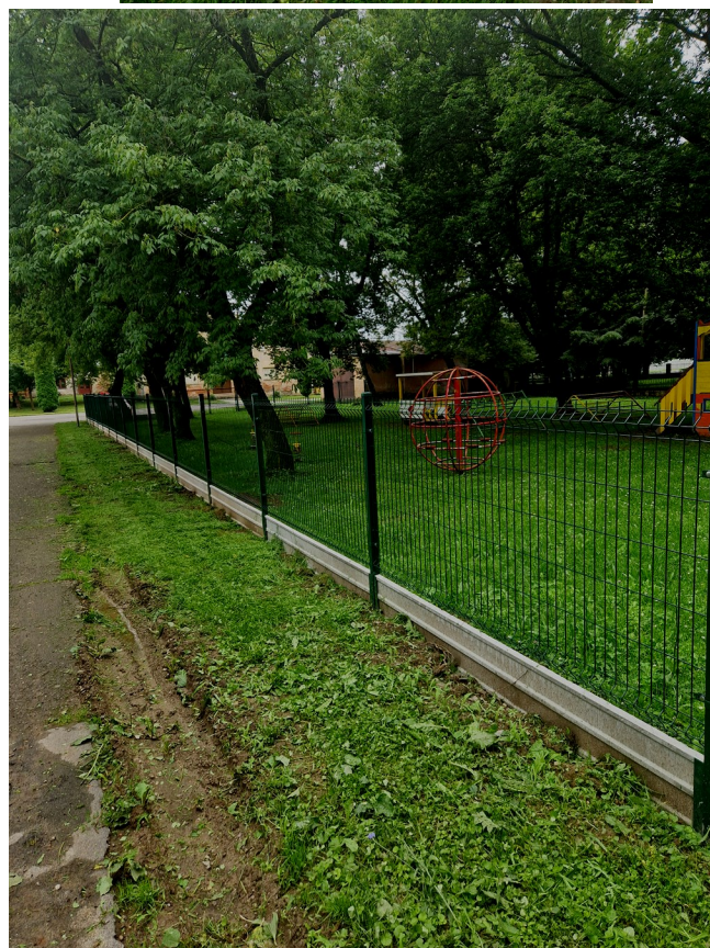
Nové oplatenie pri MŠ