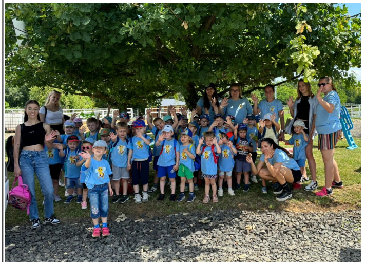
MDD - Ižkovce