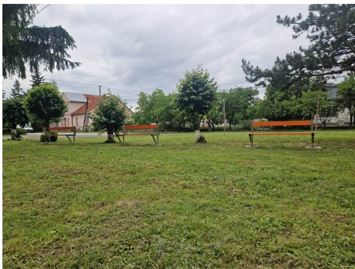
Lavičky pri Gazdovskom dome