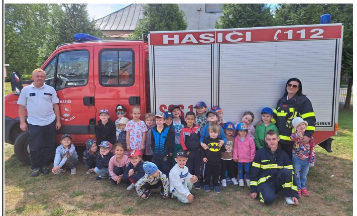
Hasiči v MŠ